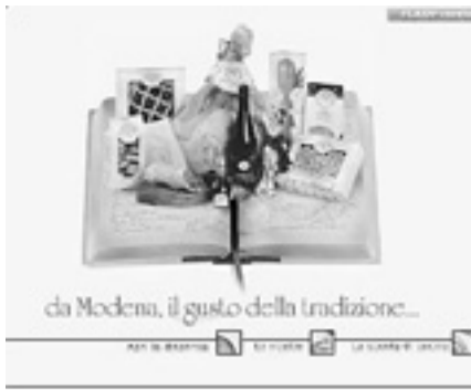
Il sito internet de «La dispensa di Giuditta»

VENDITA Da ieri al gruppo Sarni Fini cede i grill e punta a Modena su hotel, ristoranti e alimentare