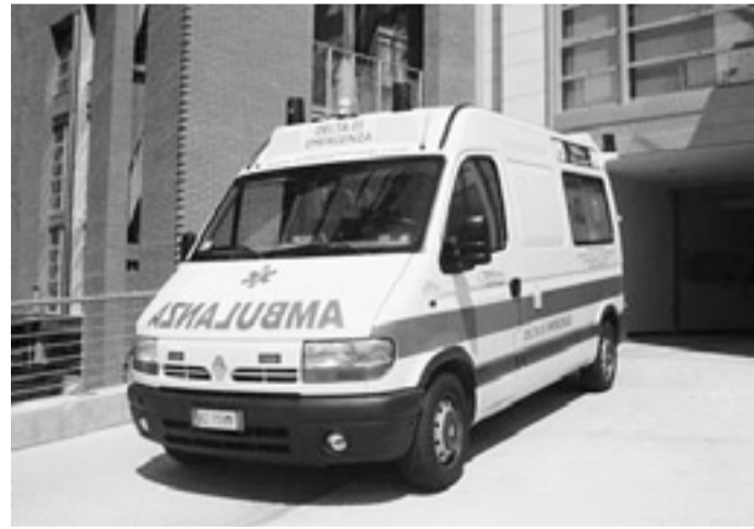
Immediati i soccorsi al ragazzino investito

Anche dopo il violento impatto ha proseguito per alcuni metri prima di accostare la sua Ford Ka.