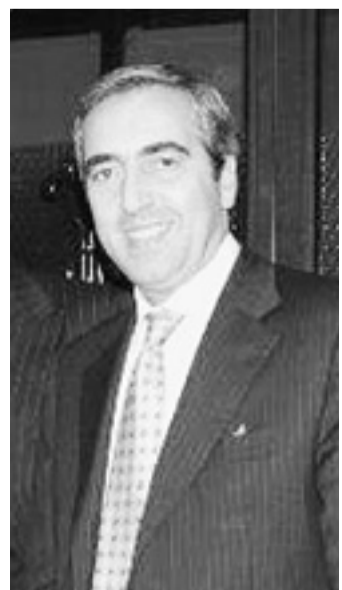
L'ex ministro Maurizio Gasparri

Introducendo l'incontro, il consigliere Michele Barcaiulo è tornato sul movimentato consiglio comunale di giovedì: «Come a Roma, anche a Modena abbiamo un'amministrazione che parla mille lingue e fa ostruzionismo contro sé stessa per non affrontare le spaccature che dividono i diversi animi che la compongono. Il Centro di permanenza temporanea deve continuare a funzionare con la legge vigente».