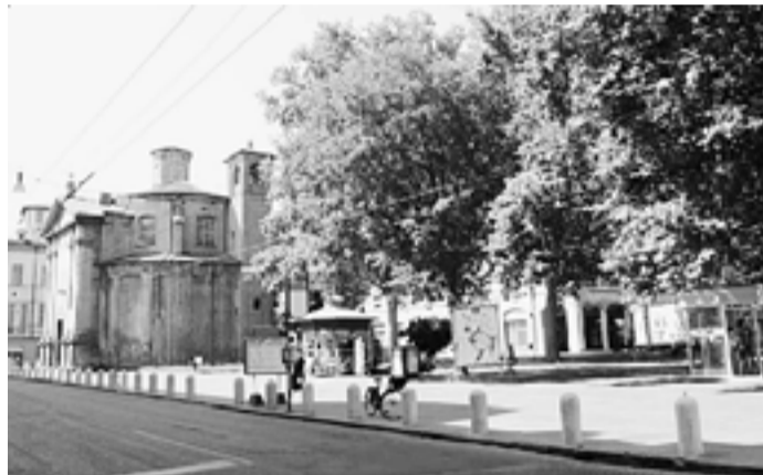
Sopra Piazza Matteotti vista da corso Duomo, sotto il progetto della pista di Marzaglia