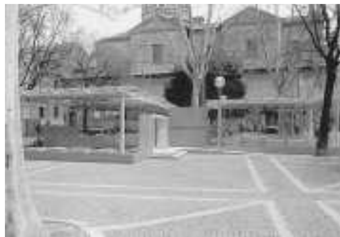
Una ricostruzione al computer su come diventerà piazza Matteotti